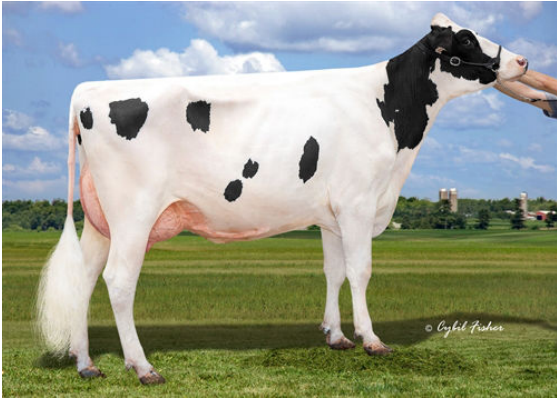
MIDAS-TOUCH DOC JAY DAM