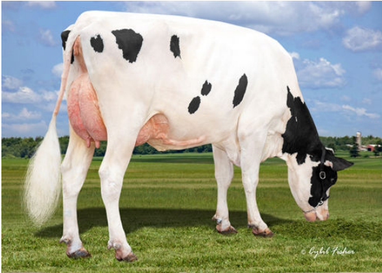
MIDAS-TOUCH DOC JAY DAM