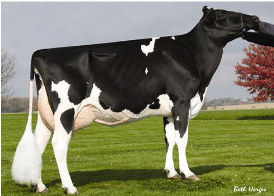
AMMON-PEACHEY SHAUNA FIFTH DAM